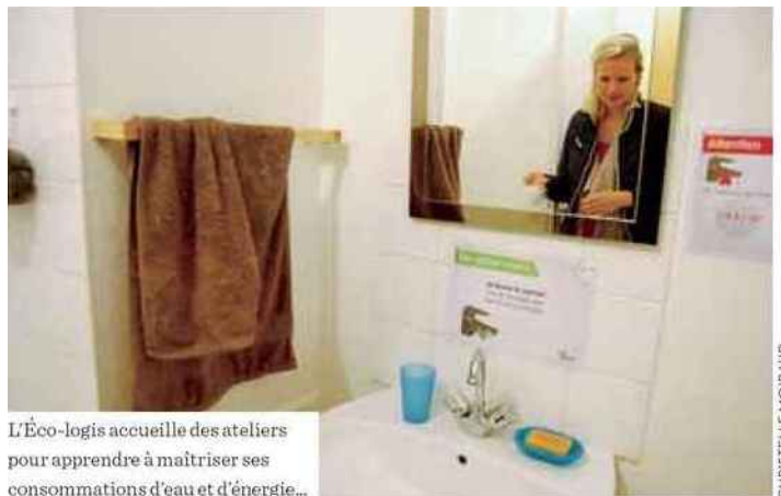
L'Éco-logis accueille des ateliers pour apprendre à maîtriser ses consommations d'eau et d'énergie...